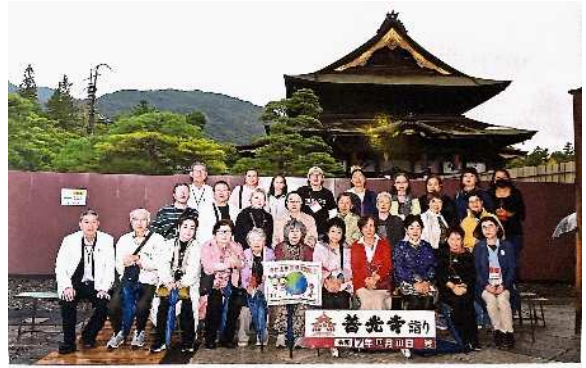
東松山市国際交流協会

ご が たの とし その後、りんご狩りで 楽しい ひと時を す こうりゅう ふか 過ごして 交流を 深めることが できました。